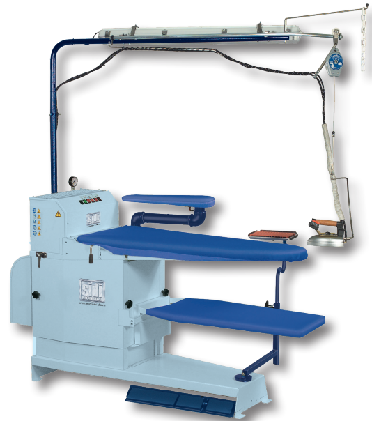
Nova Vapor + caldaia (regol.)