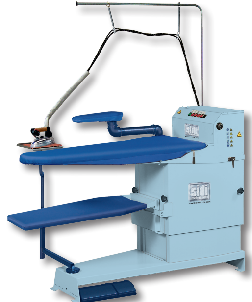
Nova + caldaia (regol.)